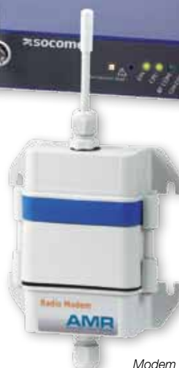
Modem radio Wireless M-Bus.