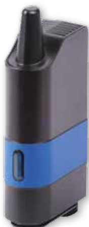
Modem radio ARF868.