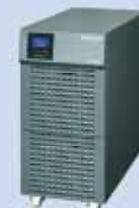
USV - Typ S ohne Batterien