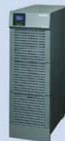
USV - Typ M mit Batterien