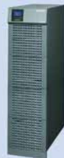
USV - Typ T mit Batterien