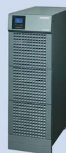
ASI - Type M Avec batteries