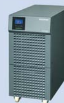
ASI - Type S Sans batterie